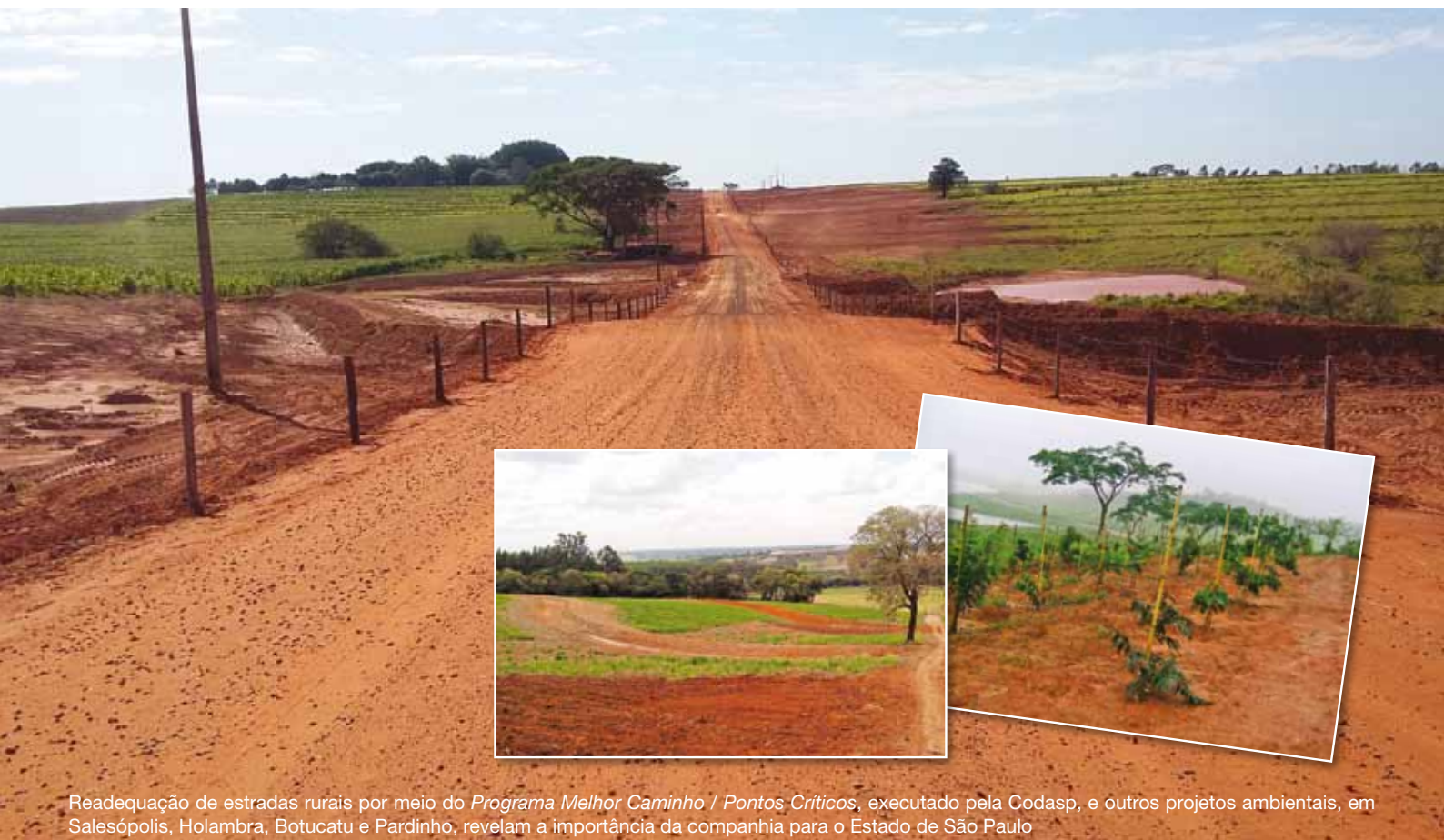
Readequação de estradas rurais por meio do Programa Melhor Caminho / Pontos Críticos, executado pela Codasp, e outros projetos ambientais, em Salesópolis, Holambra, Botucatu e Pardinho, revelam a importância da companhia para o Estado de São Paulo

Desde a sua fundação, há quase 90 anos, a Codasp tem exercido papel fundamental no desenvolvimento sustentável do Estado de São Paulo, por meio de atividades de preservação e recomposição ambiental, conservação de recursos naturais, readequação de estradas rurais, entre outras. Agora, a companhia se prepara para uma nova fase, com o apoio de um Planejamento Estratégico, que estabelece novas ações e metas para os próximos cinco anos. Páginas 4 e 5