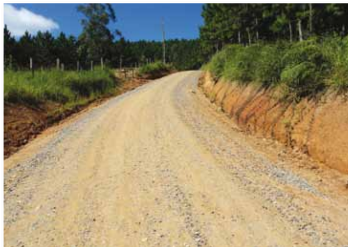
Programa Melhor Caminho / Pontos Críticos recupera 20 quilômetros de estradas rurais em Itapirapuã Paulista

A obra, que readequou cerca de 10 quilômetros de vias, agilizou o escoamento da safra e melhorou o dia a dia de todos. Ele também destaca a qualidade do Programa Melhor Caminho . “As usinas mantêm algumas estradas daqui, mas fazem obras apenas para quebrar um galho, ou seja, sem o conhecimento técnico, os critérios e a engenharia da Codasp. Em 30 anos que resido aqui, nunca vi um trabalho tão bom como o de vocês”.