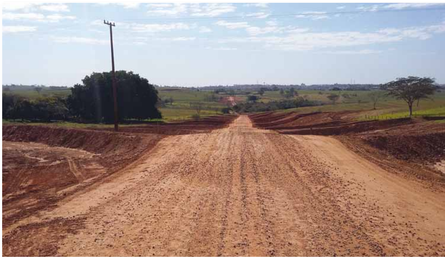
Obra do Melhor Caminho , executada pela Codasp na região de Presidente Prudente, se destaca pelos bolsões e bacias de captação de águas pluviais

Além de possibilitar ganhos econômicos e ambientais aos municípios beneficiados, Programa Melhor Caminho / Pontos Críticos, executado pela Codasp, tem o papel social de mudar a vida de milhares de pessoas no interior do Estado de São Paulo