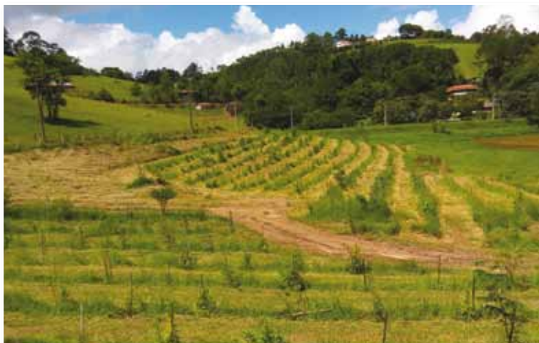
Árvores, plantadas pela Codasp às margens da Represa de Paraitinga, em Salesópolis, já estão florindo e dando os primeiros frutos

No total, serão plantadas cerca de 110 mil mudas de 80 espécies nativas da Mata Atlântica em 66 hectares ao longo da represa de Paraitinga. Até abril deste ano, foram plantadas 72 mil mudas de árvores. “Neste trabalho, consideramos as especificidades de cada bioma e tentamos reconstruir a mata natural daquele ecossistema”, explica o engenheiro Rodrigo Baesso, gerente da Regional Sudeste da Codasp.